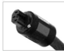
HIGH END-Version C15 (C13)