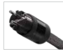
HIGH END-Version SCHUKO