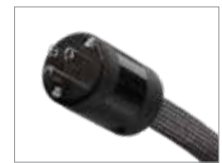
HIGH END-Version US