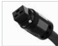
HIGH END-Version C19