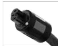
HIGH END-Version C15 (C13)