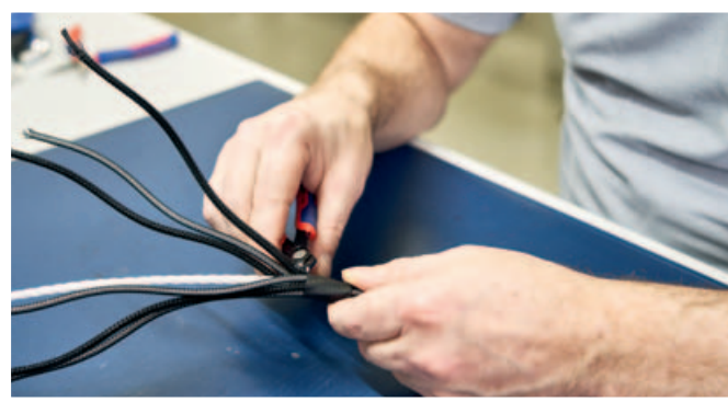
Im Finale braucht es die Hand. Die Kabel werden auf Maß geschnitten, der Kontakt freigesetzt und mit Schuh oder Stecker verbunden.

Das ist die Manufaktur der Moderne. in-akustik weiß genau, bis zu welchem Level die Maschinen rackern müssen und ab wann die Menschen mit ihrem Wissen und ihren Händen gebraucht werden. Hier im Badischen ist es ein Team von acht Mitarbeitern. Alles folgt den